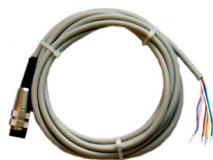
Connecting cable Cable de connexion Art. Nr.: 202.160.0420