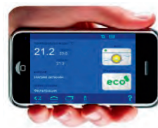
Управление по смартфону

УДОБНО И ПРАКТИЧНО! Наш бесплатный OST-коммуникационный-сервер для связи через интернет.