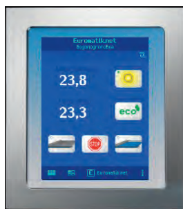
Внешняя панель управления (опция)